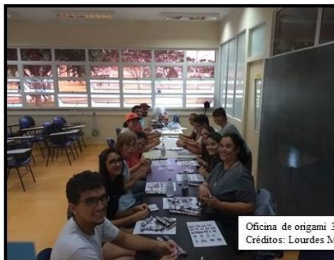
Oficina de origami 3D