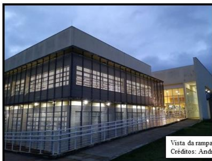
Vista da rampa de acesso