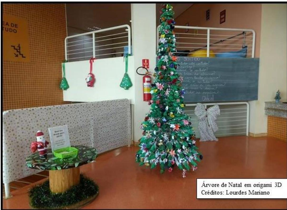
Árvore de Natal em origami 3D