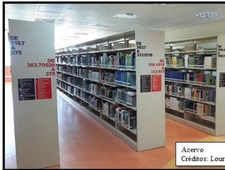
Acervo Créditos: Lourdes Mariano