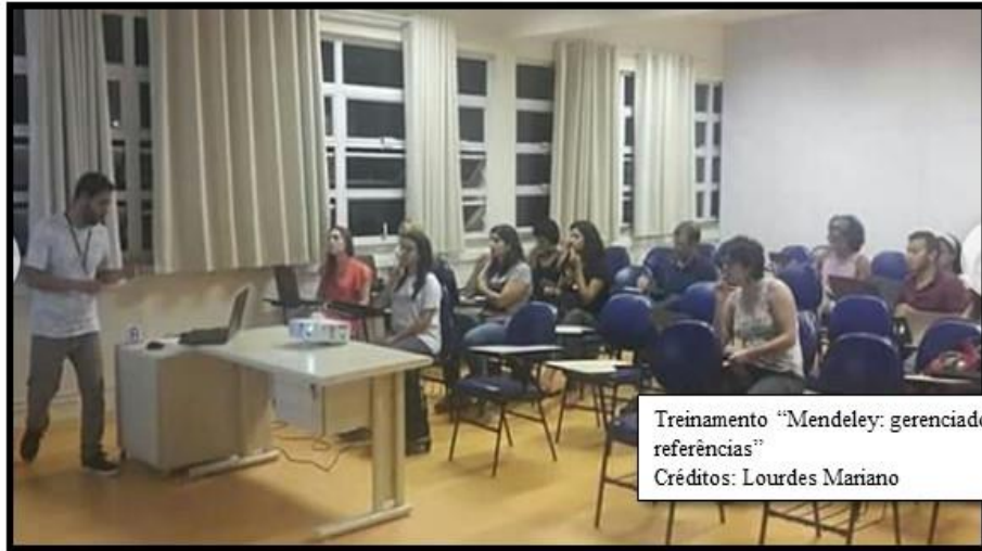
Treinamento “Mendeley: gerenciador de referências” Créditos: Lourdes Mariano