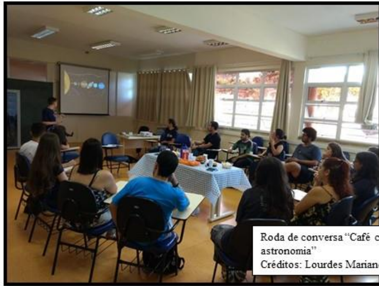
Roda de conversa "Café com astronomia"