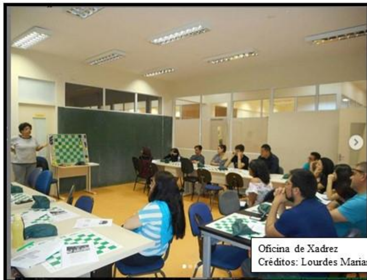
Oficina de Xadrez