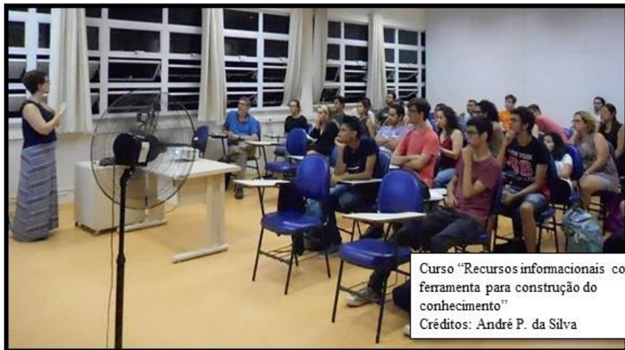
Curso “Recursos informacionais como ferramenta para construção do conhecimento”