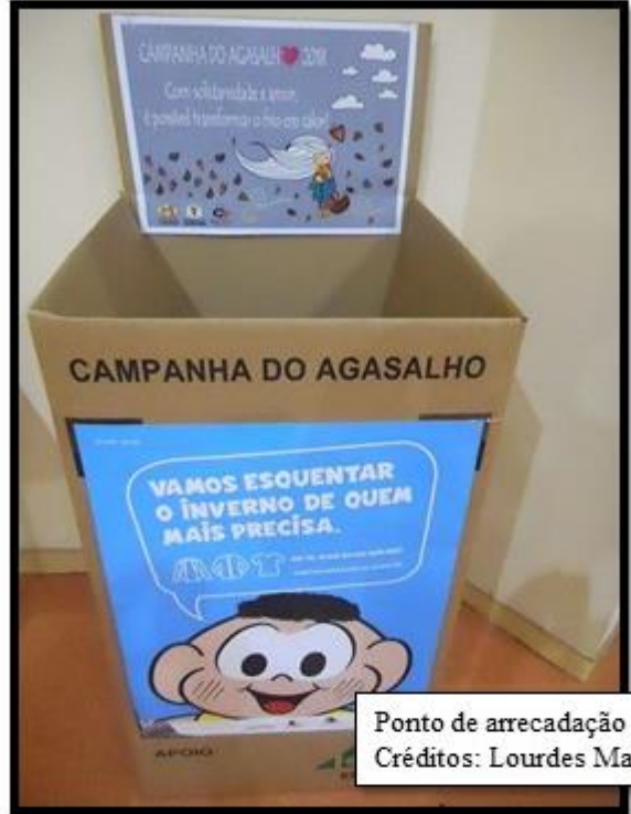
Ponto de arrecadação