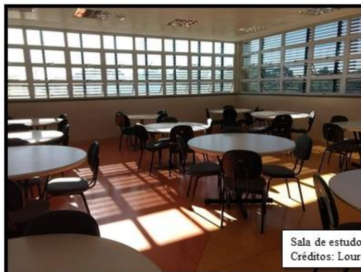
Sala de estudo em grupo