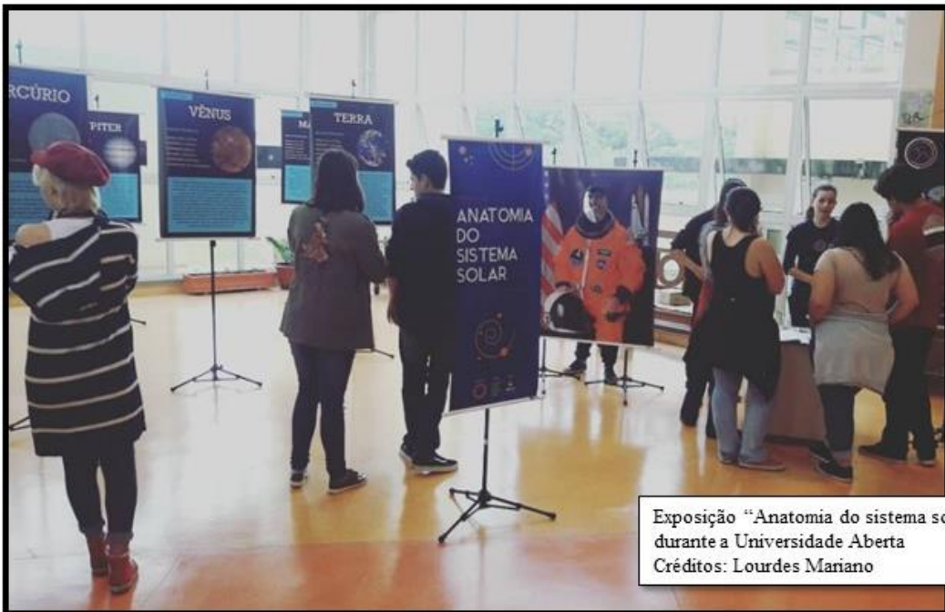
Exposição “Anatomia do sistema solar” durante a Universidade Aberta