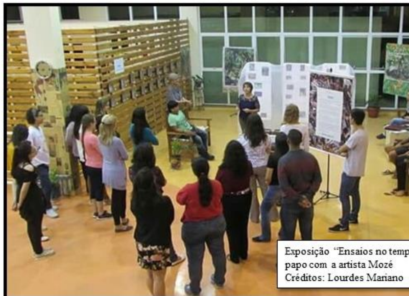
Exposição "Ensaio no tempo" e bate-papo com a artista Mozé