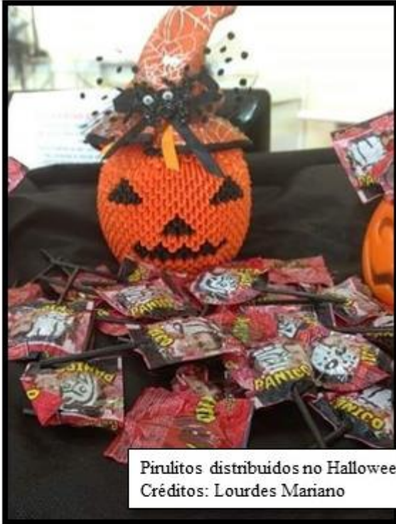
Pirulitos distribuidos no Halloween