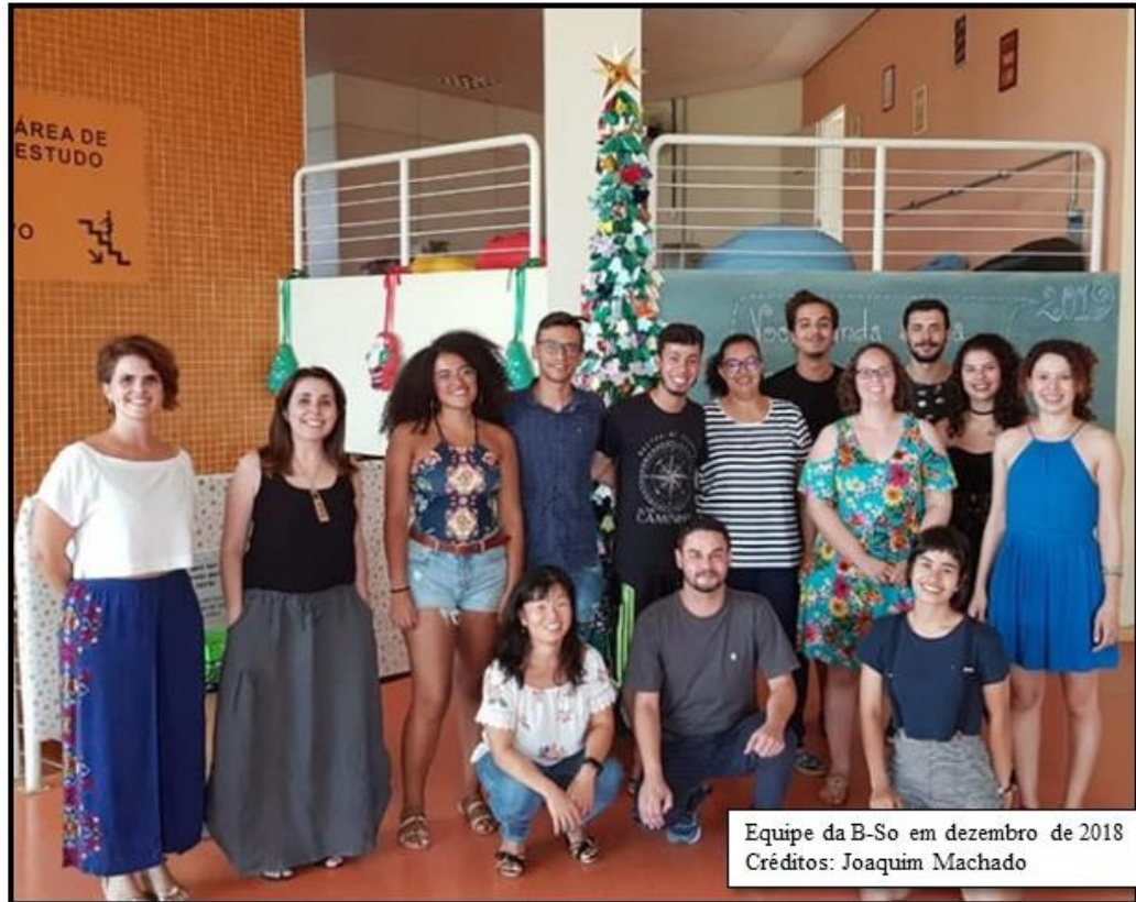
Equipe da B-So em dezembro de 2018