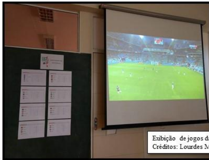
Exibição de jogos da Copa do Mundo