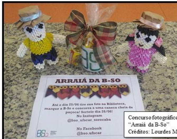
Concurso fotográfico e sorteio no "Arraiá da B-So"