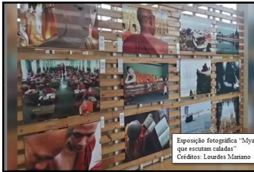
Exposição fotográfica "Myanmar: vozes que escutam caladas"