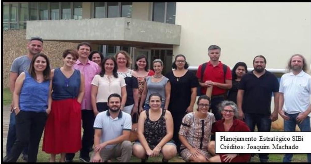
Planejamento Estratégico SIBi